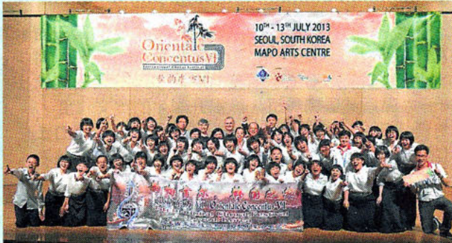
■恒毅中学参与2013年韩国国际合唱赛,获全场总冠军。