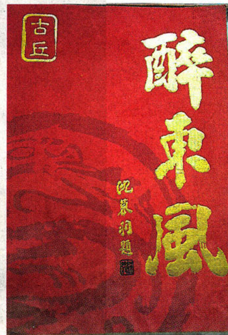
← 已故拿督沈慕羽對中六華文班非常支持，更曾為《古丘》親題書名。