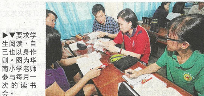
要求学生阅读，自己也以身作则。图为华南小学老师参与每月的读书会。