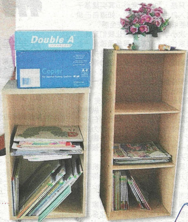
家去，只剩下寥寥落落的几本在书架里。放学了，班级阅读角的书都被孩子带回家。

那是一种快乐、投入的背诵姿态，就像很多人小时候都曾有的经验。孩子可能不明白内容在说什么，但一首首的经典作品，一句句优美词句，就这样深植孩子记忆深处。