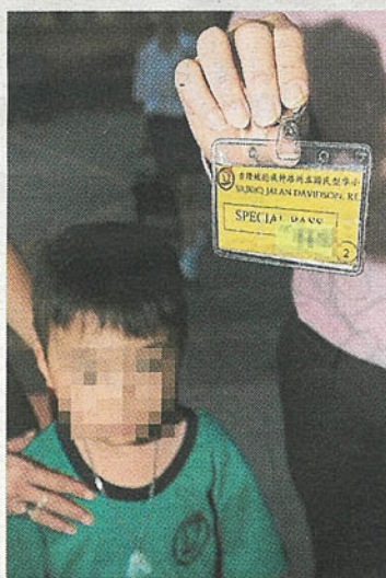
孩子若行动不便或患有先天性疾病，其家长可获得学校的特别通行证，到教室接送孩子。