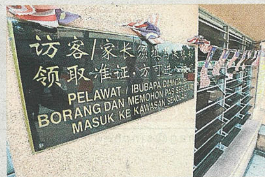
所有访客包括学生家长在进入校园之前，必须向保安人员登记和领取通行证。