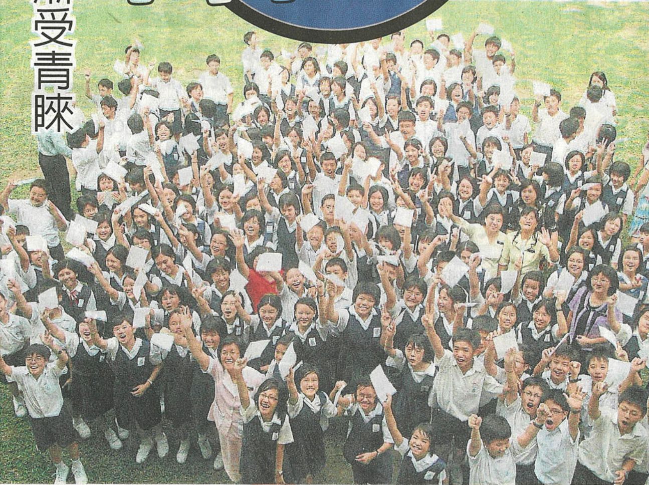
■华小若不改革僵硬应试教育，华裔家长未必会送孩子进华小。