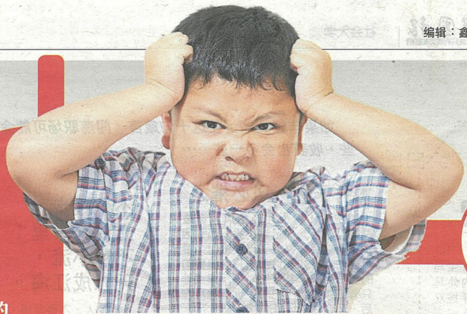
■对性的理解不足够，可能会感到害怕和愤怒。图为情境照。