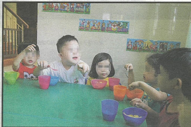
■让特殊孩童接受性教育，是保护他们的其中一种方式。

“还有，可能他们的生活很苦闷，尤其有些孩子，每天留在家中没事做，他们可能就把注意力放在感官上，比如一直触摸，会有快感，也不懂得找适合的地方。”