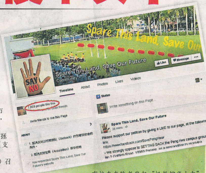
有校友在脸书发起“拯救檳華女中”的请愿活动。小图为截至下午2时30分，该脸书专页的按赞人数逾7千人。

曹观友今日受询时说，他周五(26日)与负责檳華扩建计划的建筑师讨论后，决定先与董事部再见面商讨，因此取消了原定的新闻发布会。