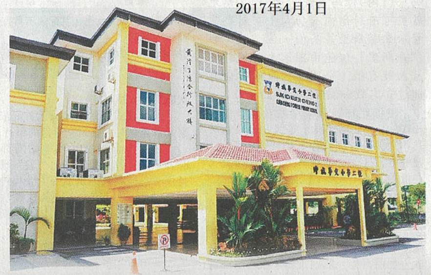
坤成华小二校被教育部鉴定为高绩效学校。

但是,校方并没有强制我们购买这些练习簿,只不过我们希望孩子能先做好功课,做好充分准备,才参加入学试;大部分的家长都会买来翻阅,好让孩子能有万全准备。” 她表示,除了坤成华小二校之外,她也曾前往其他华小探究,但她发现并非每所华小都会实行入学测