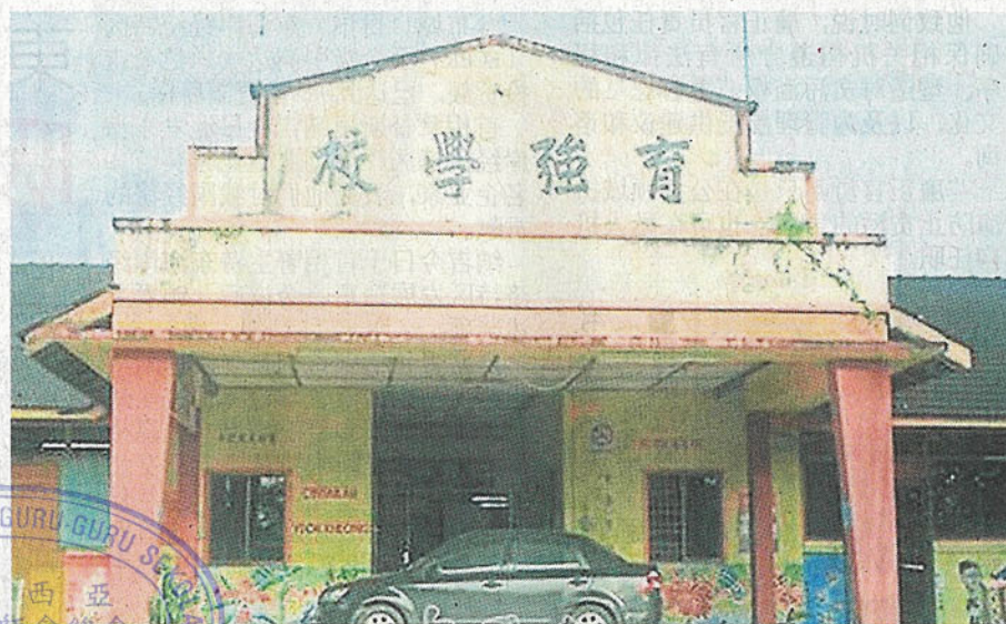
生。司南馬育強華小是微型華小，約有44名學