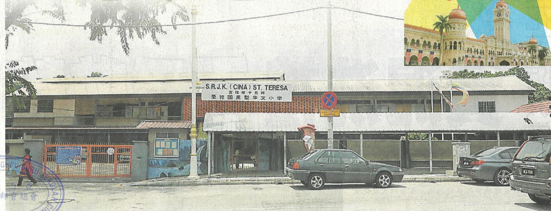
■圣德华小校地地契,将在12月届满。