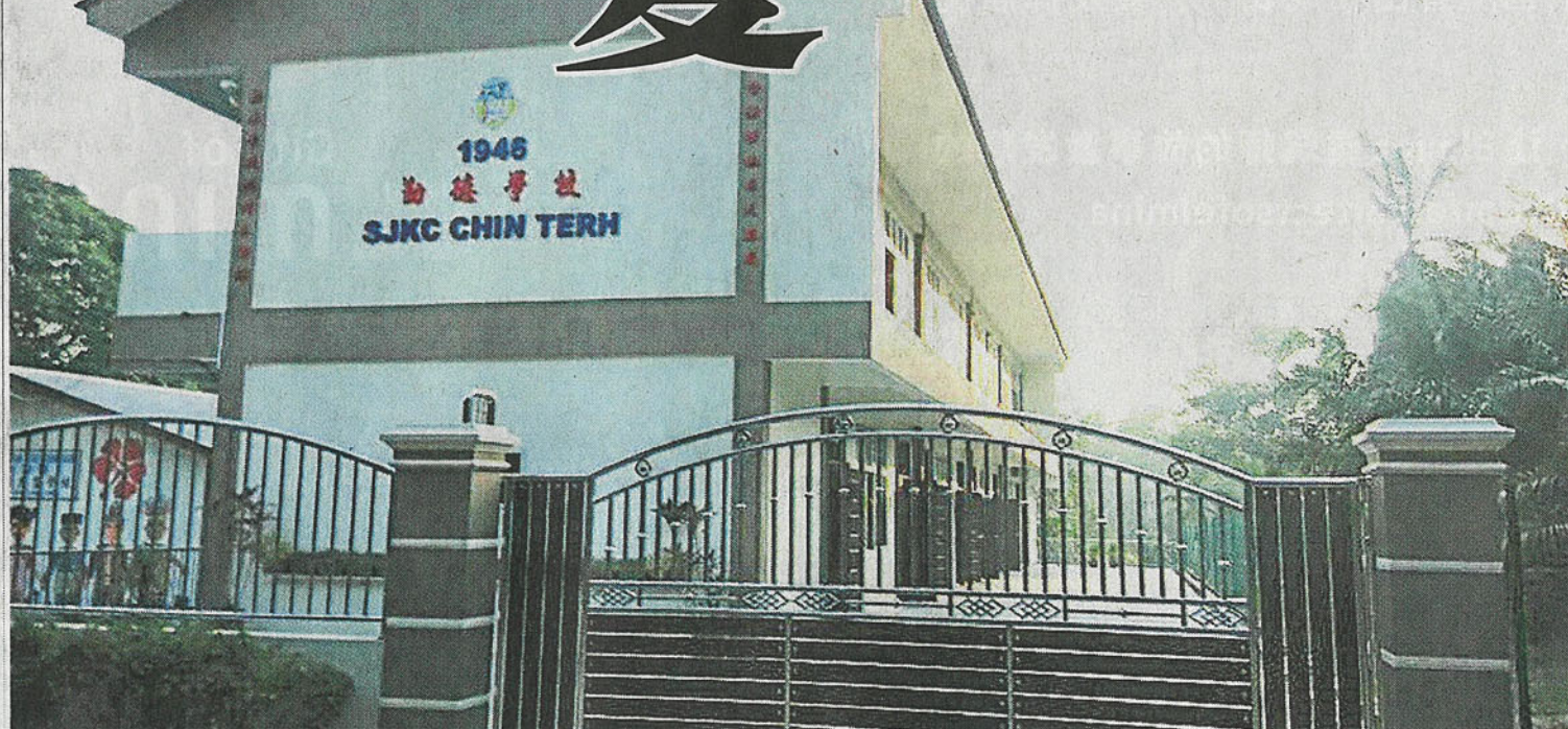
麻坡勤德學校地主南益樹膠有限公司于去年9月接獲土地局來函，指政府有意征用土地作為工業區用途。