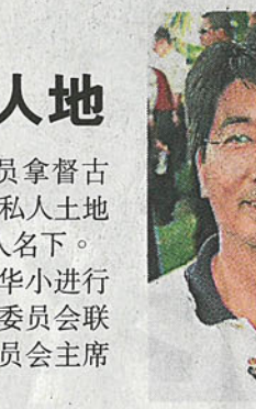
古乃光：甲州65所華小並沒有建在私人土地上。

馬六甲州署理主席兼亞羅牙也國會議員拿督古乃光表示，甲州65所華小並沒有建在私人土地上，半津貼華小的土地都是註冊在董委會信託人名下。 他說，甲州馬華大約10年前曾經為本坡的華小進行資料搜集工作，當時是由州法律局及教育諮詢委員會聯合進行，而他當時是法律局主任，教育諮詢委員會主席則是戴佛遜。 他接受星洲日報訪問時說，早年甲州的益智華小、峇章華小及鼎華小學，確實面對土地風波，但這3所華小目前都已搬遷。