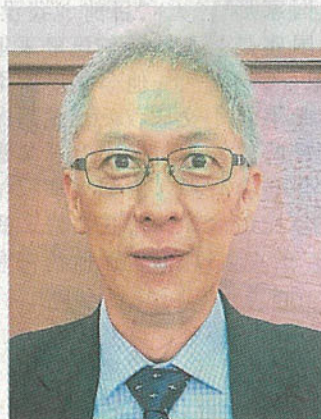
童星存：其中 200 万捐款已汇入学校户头。

他说，郭鹤年也关心，以母亲郑格如命名的该校“郭郑格如楼”最新近况，考虑到校内已有母亲之名的建筑，郭鹤年建议这次以父亲郭钦鉴之名，为教学大楼命名。