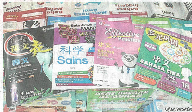
许多家长会于年终假期前为孩子采购作业簿，以便孩子提前学习新学年的课程。