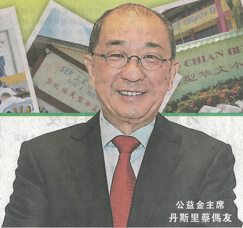
公益金主席 丹斯里蔡僑友