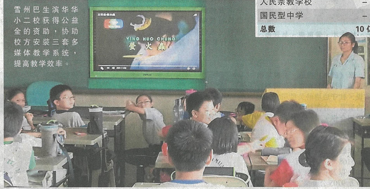
雪州巴生滨华华小二校获得公益金的资助，协助校方安装三套多媒体教学系统，提高教学效率。

谈及设立华小部门的建议，似乎将牵涉到政治现实的问题，蔡僑友坚持这是教育部的管理与行政失当，无关政治，他也不想谈论政治。