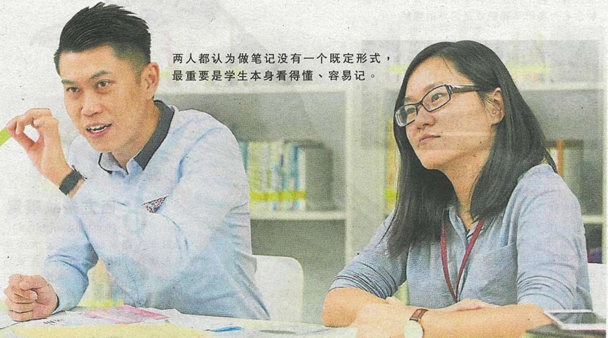
两人都认为做笔记没有一个既定形式，最重要是学生本身看得懂、容易记。