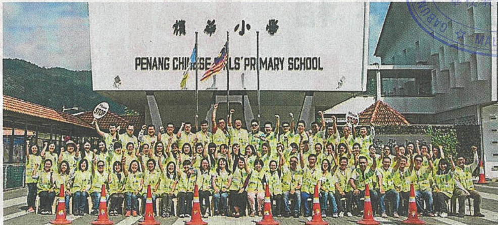
槟华小学爱心家长团目前的固定成员增至150名成员。