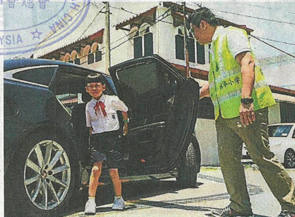
爱心家长的义举，不仅使无数的孩子感受到“爱”，也获得家长的赞许。