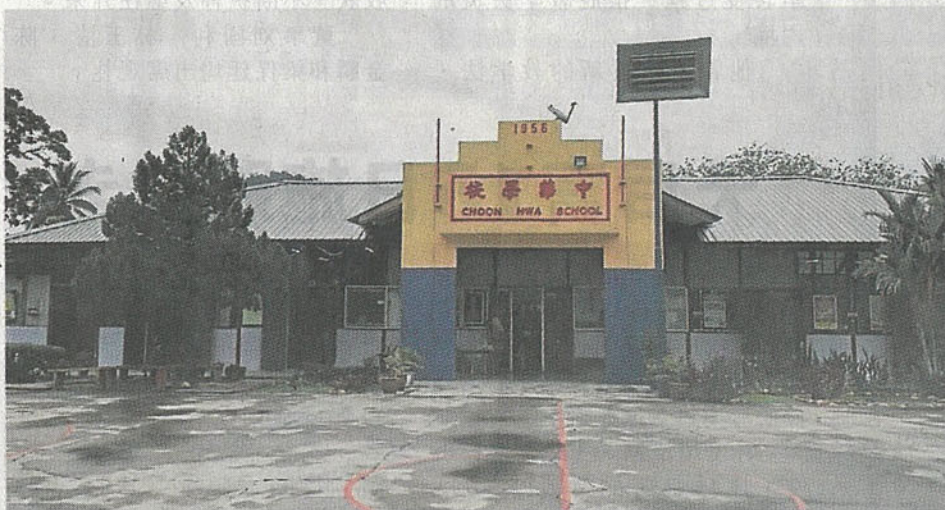
呀吃18里中华小学预料3年后可迁入新址。