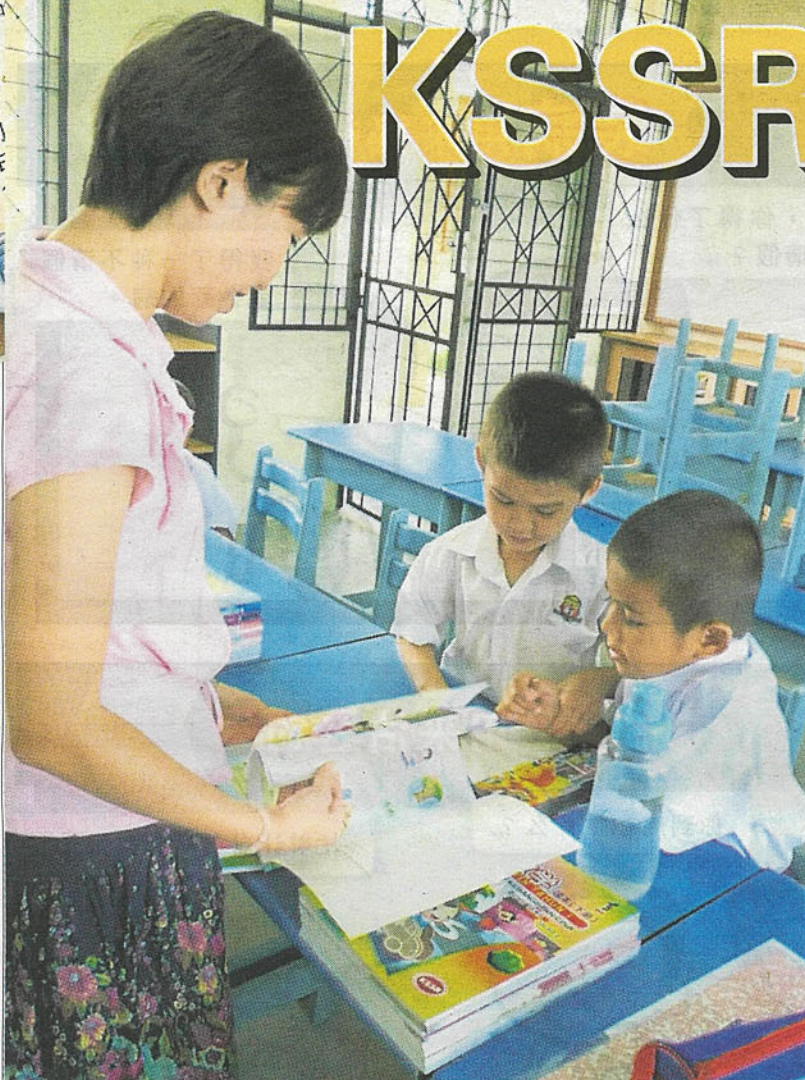
老师的角色转换, 从教导者, 变成引导者, 令部分老师无所适从。

游临终前 国、报人热烈 诗人热烈 元知万事空 不见九州同 自北定中原 祭无忘告乃