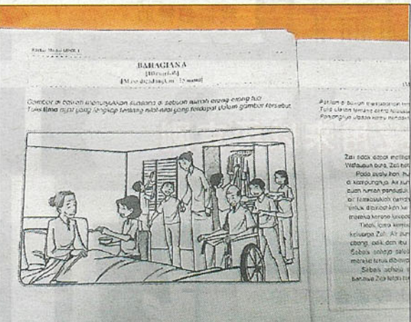
在小六评估考试中增加了英文试卷二, 加重了学生以及老师的负担。