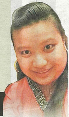
林雯艳老师认为, 老师还需要渡过适应期。