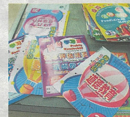
一些人质疑校本评估不能取代公共考试。