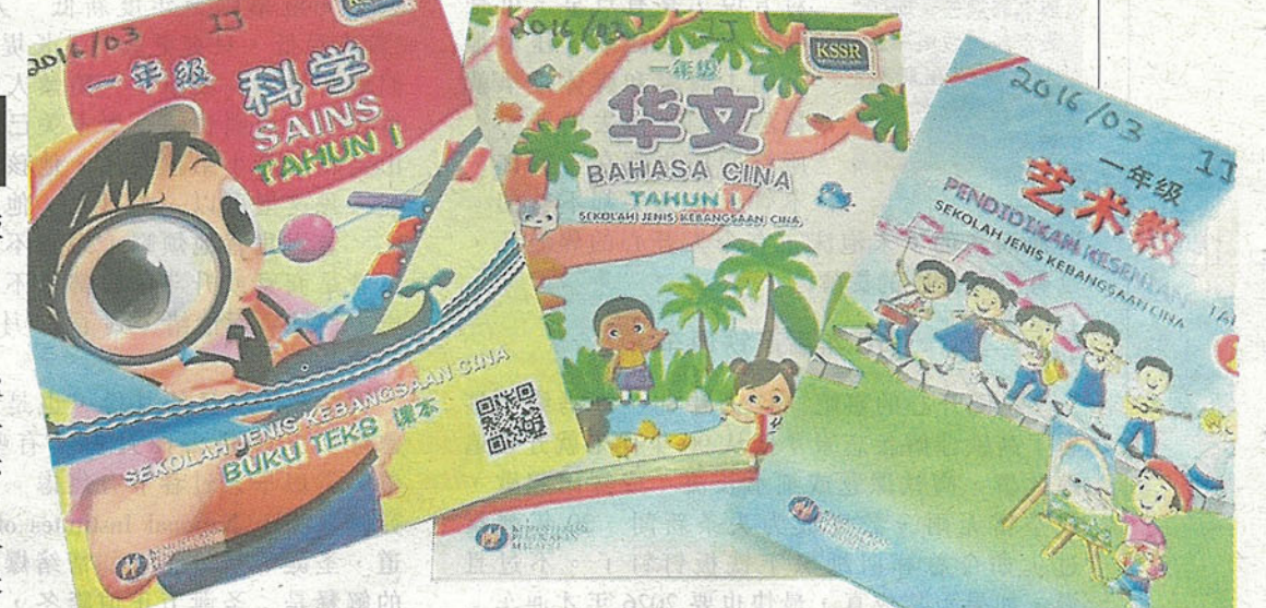
2017年KSSR Semakan一年级全新课本。