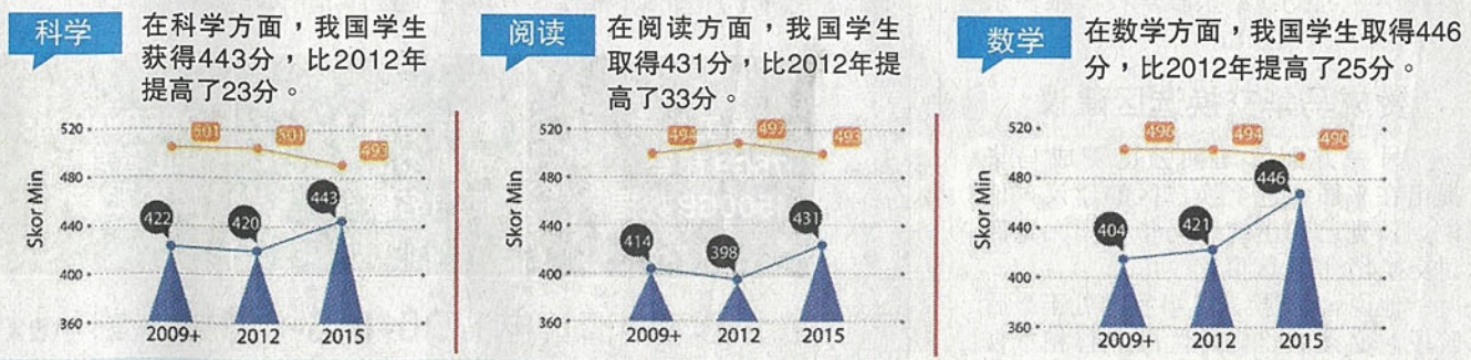
2015年国际学生能力评量 (PISA) 成绩显示，大马学生在阅读能力、数学和科学方面都有进步。

马哈基尔：使用科技配备及更开放、互动、集中的教学方式，转变教师的角色，也培育出精明的学生。