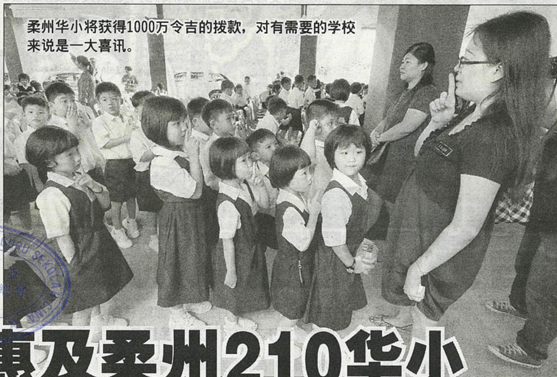
柔州华小将获得1000万令吉的拨款，对有需要的学校来说是一大喜讯。