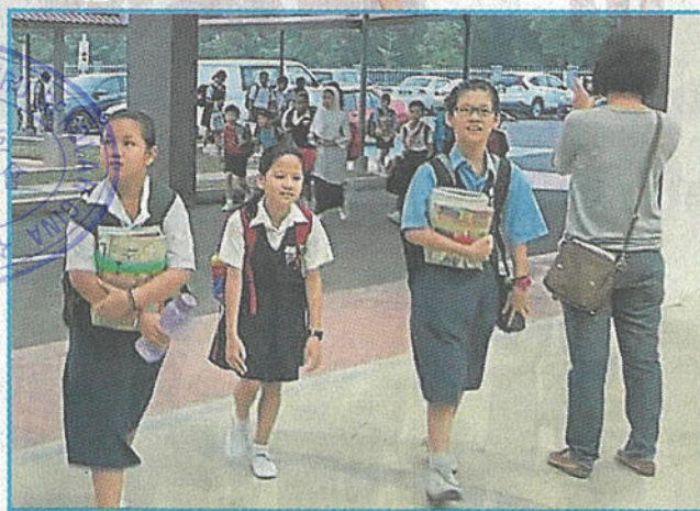
学生在新校舍上课，心情格外愉快。