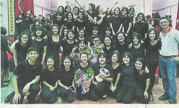
独中教师除了例常授课，也得在假日协调学生外出筹款的工作。（档案照）