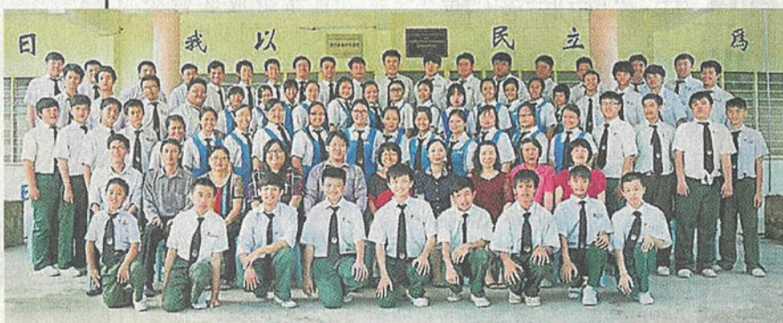
民立中學全體師生合影。