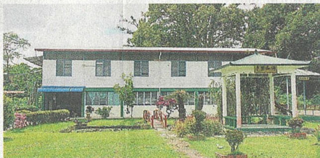
公民中學校園內的小亭、小橋，後方是學生宿舍。

他說，該校通過各種方式獲得款項維持學校，如喜喪事、社團組織的捐款、州政府撥款、也透過養蜂錢，或是舉辦籌款活動、义賣、徒步义走、售賣彩票、醒獅團賀年等。