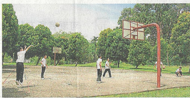
公民中學今年另一項計劃是在現有的籃球場設雨蓋，為學生提供更好的運動空間。