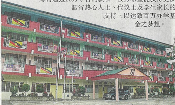
校園內4層樓鋼骨水泥校舍，讓學生們能舒適地上課、學習。

今年該校董事部如火如荼發動籌募百萬辦學基金活動及舉行百年校慶活動，並獲得外省各界人士的積極響應，目前籌得超過20萬令吉的款項，校方希望能獲得更多泗省熱心人士、代議士及學生家長的支持，以達成百萬辦學基金之夢想。