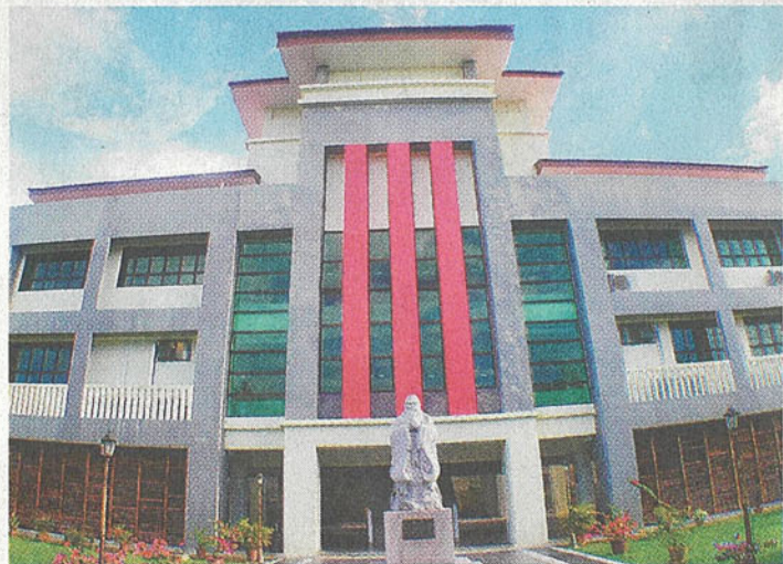
培正中學的孔子花園，環境舒適。

在現有教育政策下，儘管私立或國際學校已遍地開花，但是要申辦一間符合所有人期待的獨中，一點都不容易。因此，獨中的守護者都是秉持“一間都不可少”的理念，即使學校再微型，也不能放棄，苦苦堅守。