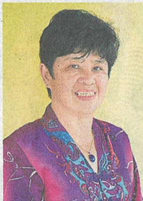
張碧玉學校多年，從愛心教育到行知賞識教育，培正如今是沙巴行知賞識教育典範。