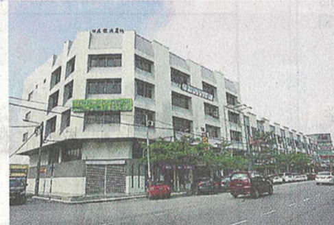
峇株巴轄五校董會1985年建成的五校大廈以及近年才建成的新店屋，為董會帶來租金收入，以減輕董會的龐大經濟壓力。