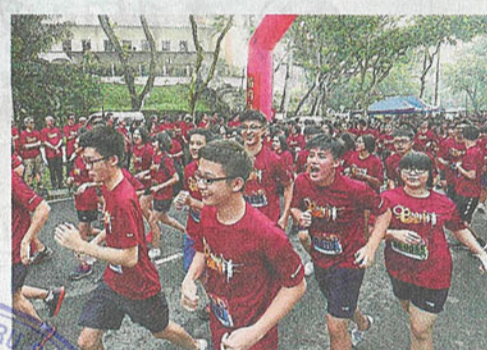
为了应付入不敷出的情况，各独中不时都会展开筹款活动，如义跑、舞狮采青、义卖会、旧品回收、园游会及场地出租等。

另外，培中董事会早前投资马六甲假日酒店（Holiday Inn）股份，每年都获得分红回酬。由于该公司筹划上市，因此于2005年以高价向培中回购股份，使得培中获利良多。