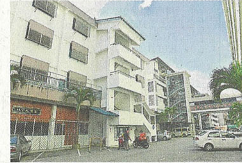
芙中是全馬最多寄宿生的獨中，宿舍費成了芙中最大的收入來源。