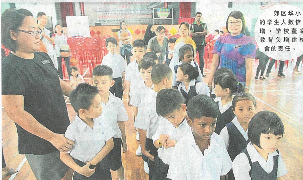
郊区华小的学生人数倍增，学校董家教背负增建校舍的责任。