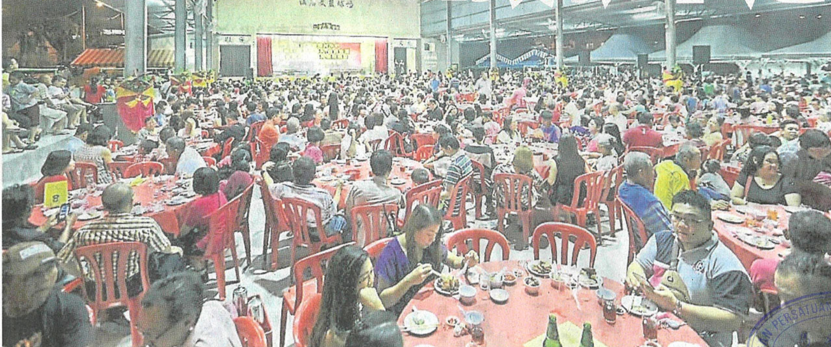
芙蓉万茂新村华小的雨盖礼堂建设，让学生可在更舒适环境下进行活动或周会。

(芙蓉 24 日讯) 华校董家教并没有基于“人有我有”的心态，大肆筹款以改善学校硬体设备，反之是因为教育部拨款不敷应用而必须对外筹款，而且从未忽略校内最基本的需求。