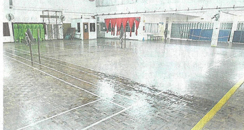
尊孔华小礼堂拥有超过35年历史，内部设施已陈旧，而且出现漏水及地板损坏的情况，去年通过十大义演筹款维修，以便孩子能在更舒适的环境下进行室内活动。(档案照)