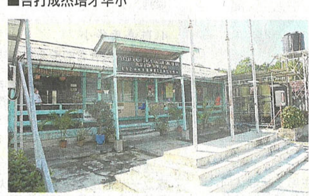
■霹靂太平大直弄益华华小。