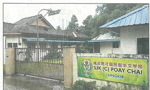
■吉打成杰培才华小