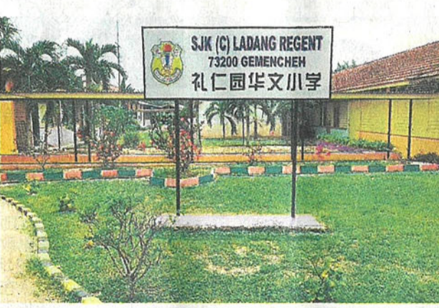
■利民济礼仁园华文小学。