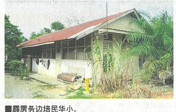
■霹靂旁边培民华小。

馬哈茲爾：母語學校是先賢共識 马哈兹尔卡力说，母语为教学媒介语的华小、淡小，纳入国家教育源流，延续先贤在国家独立时达成的共识。 “我们在独立时制定教育路线图，华小、淡小、国小，都在国家教育源流内，因为我们的先贤在当年，认同母语教育源流学校的存在。” 他说，经过60年的发展岁月，我国教育政策没有改变，只有课程纲要、教学方式及科目等有所变动。