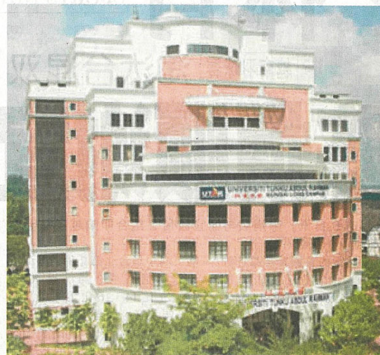
拉曼大学入选 2018 年度泰晤士高等教育世界大学排名 600 强。

《泰晤士高等教育》杂志是根据 13 个指标，为全球 77 个国家和地区的 1000 所大学进行排名，其中涵盖教学、研究论文被引用次数、国际前景和产业收入 5 个领域。