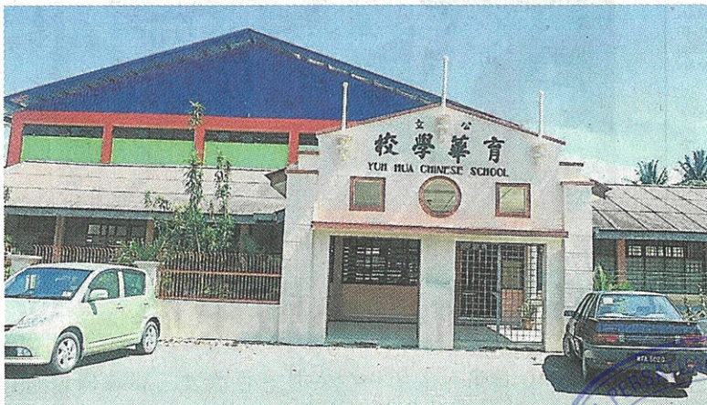
林茂育华小等待政府协助维修及改善校舍设备。