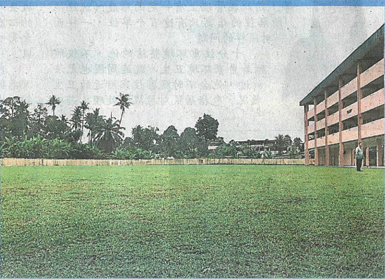
新校舍旁有辽阔的草地让学子们奔跑，环境青幽、空气清新，让无缘为子女报读的家长们感到失望。