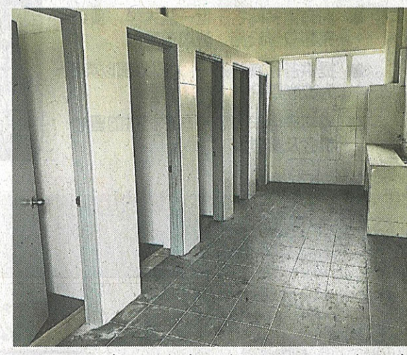
新校舍每层均备有足够的厕格，可以解决学生们大排长龙如厕的状况。