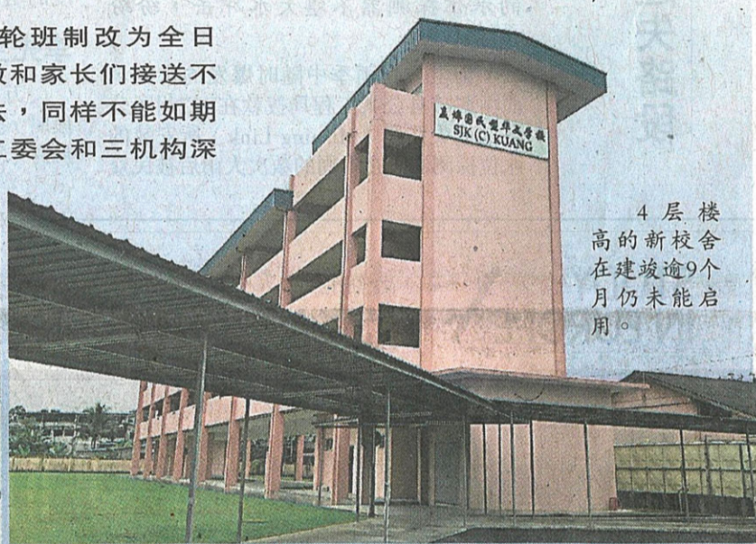
4层楼高的新校舍在建竣逾9个月仍未能启用。