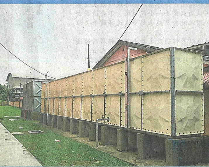
为了解决水压偏低的问题，三机构千方百计筹款，为学校建好了大型储水槽。