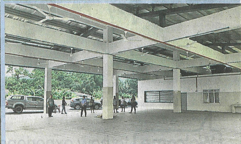
新食堂已经完工，孩子们无需再轮流用餐了。