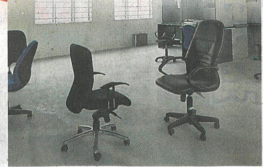
课室堆放着热心人捐献的教职员桌椅。