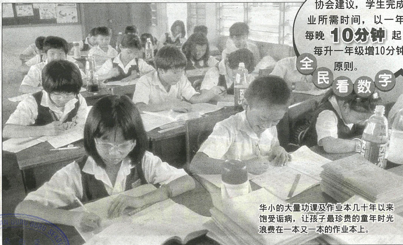
华小的大量功课及作业本几十年以来饱受诟病，让孩子最珍贵的童年时光浪费在一本又一本的作业本上。

谈起课外作业的必要性，他认为，对于资优生来说，商业作业的确可以教会孩子依靠自己的能力完成任务。「但是，商业作业簿缺乏针对性，对后段