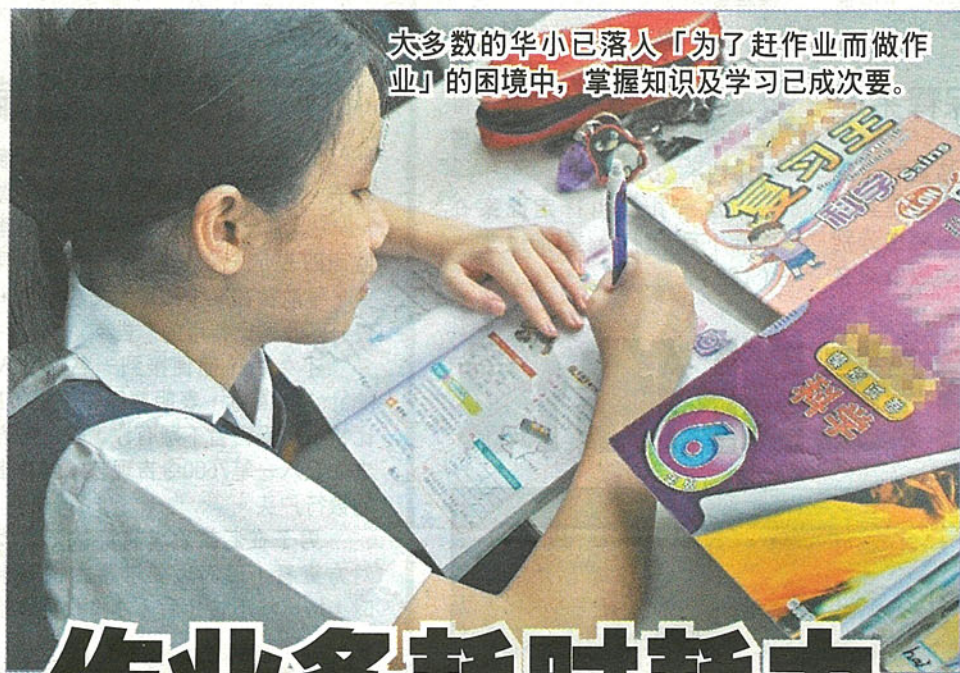
大多数的华小已落入「为了赶作业而做作业」的困境中，掌握知识及学习已成次要。