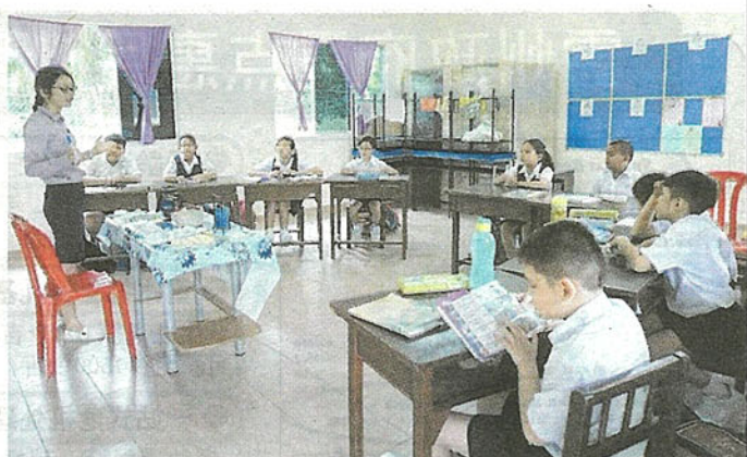
育才学校四、五年级共9名学生一同复级上课，学生座位分成左右两边，以区别不同年级学生。