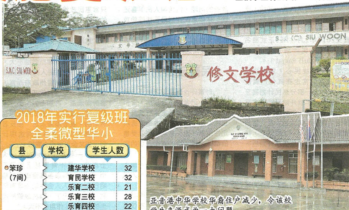
亚音港中华学校华裔住户减少，令该校学生来源成为一大问题。

「董联会目前尚在收集今年度的微型华小及复级班数据资料，预计要一周后才能取得完整数据，无论如何，董联会将继续观察，跟进复级班制带来的种种影响，包括是否能达到学习成效。」