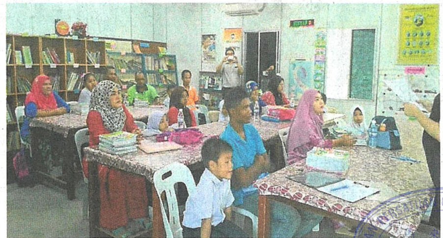
■巫裔生的家长，与孩子一起到学校学华语。