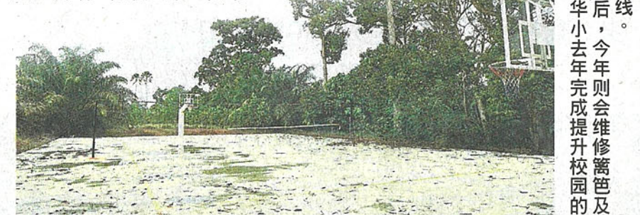
■篮球场后，今年则会提升维修篱笆及更换电线。

他补充，巫裔学生家长对新中华小的活动，反应热烈，踊跃参加之余，不时还会烹煮食物，带来活动上与他人共享；一些活动如学校运动会，也都以亲子同乐方式进行。