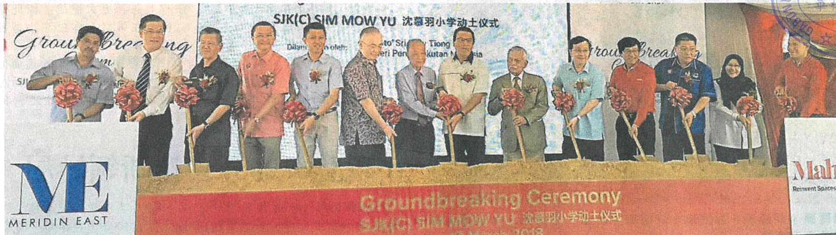
沈慕羽华小是全国 10 所新华小中第一所动土的学校。

他说, 他关心华教课题, 也相信可以协助处理华小课题, 兴建华小是利民的计划, 他可以接受前朝政府的计划, 这对华社有利。