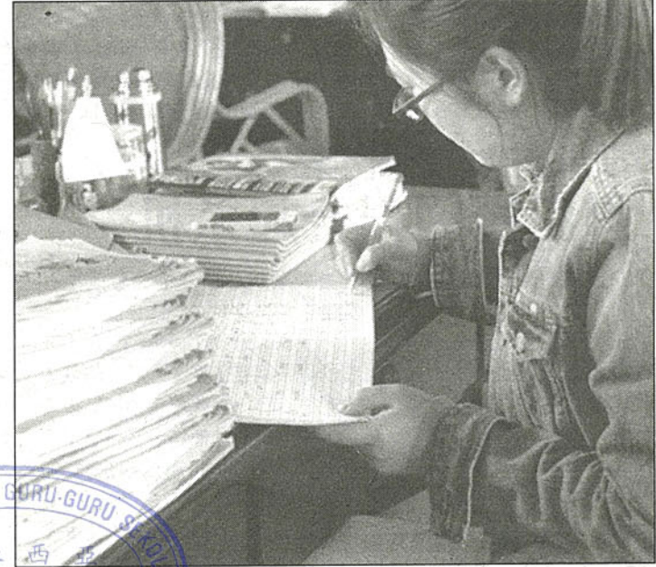
繁重的工作压力导致华小老师大喊吃不消，宁可选择提早退休。