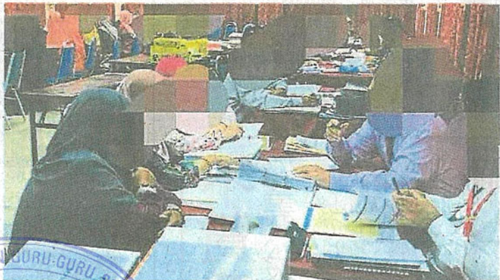
■数名教师埋头苦干，处理评估文件。