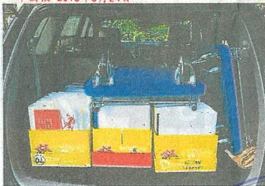
■某教师的评估文件，足以填满轿车后备箱。