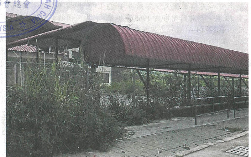
加影新城华小大门旁的候车亭被杂草掩盖。