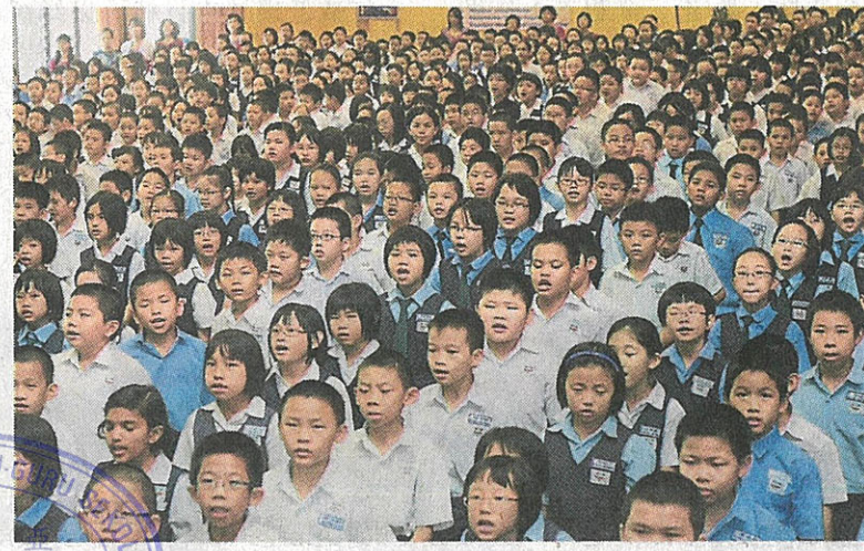
森州在近几年已没有一所华小学生超过1000人。(档案照)