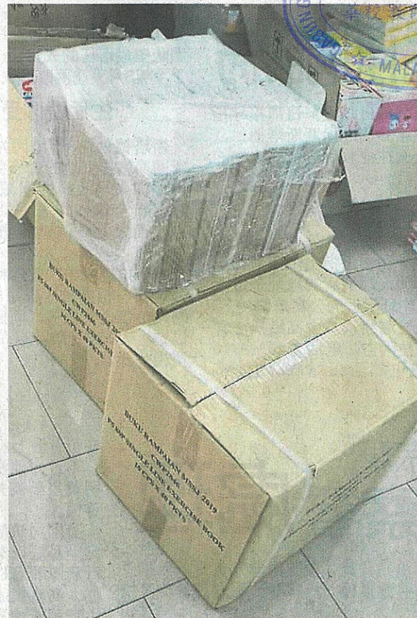
练习簿已陆续送到学校，以派发给学生。