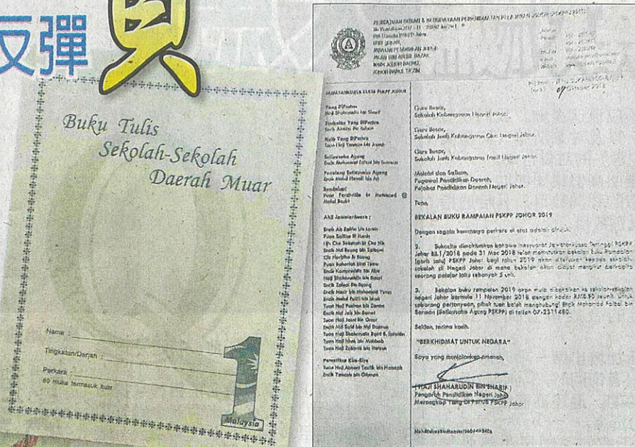
↑麻县教育局供应给学生的练习簿。