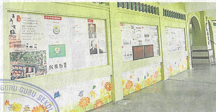
▲时光廊记载巴生中华女校创校100年来的历史事迹，以让后辈能清楚了解先贤创校的经历。