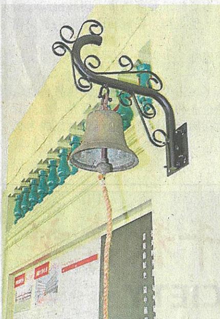
▲旧校舍的“校钟”特别架设在时光廊。