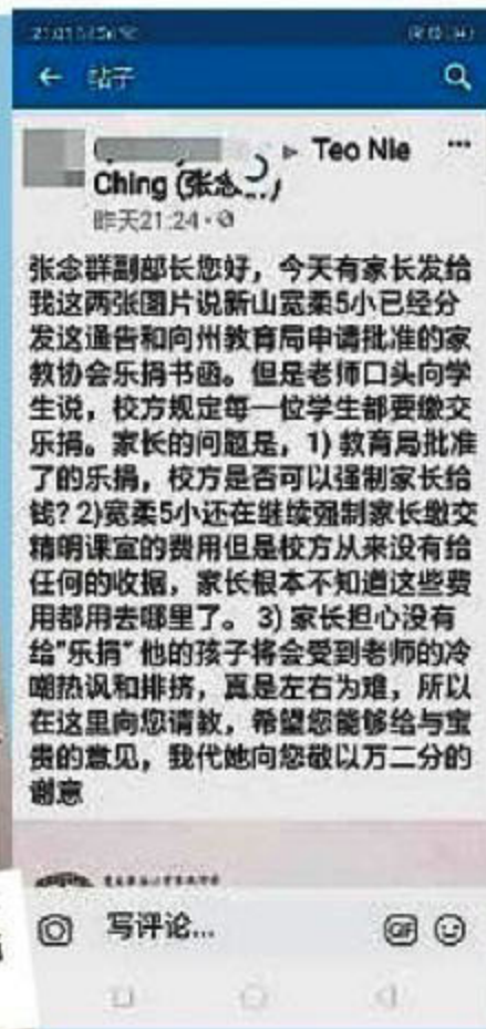
强制学生缴交乐捐。 一名女网友在张念群的脸书专业留言有关新山宽柔五小校方