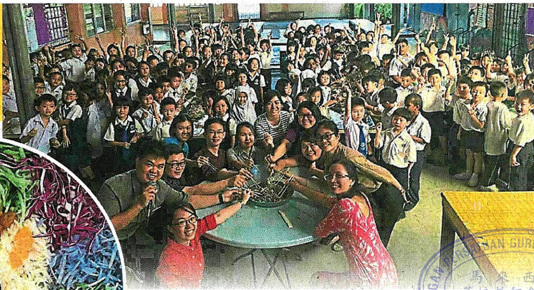
←老师们用蔬果排出卖相可爱的“猪头”撈生盘,让华裔学生欢喜尖叫。