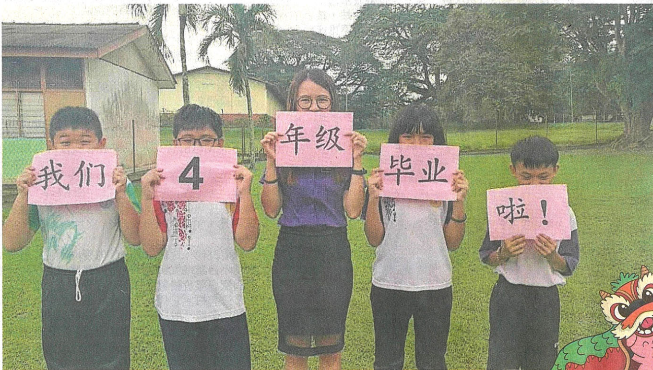
◀ 学生的每个里程碑，我都用心拍照记录。