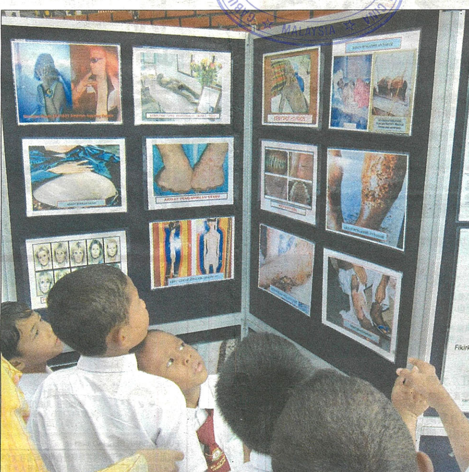
校方及执法单位定期在校内及其他学生聚集的地方进行反毒宣导活动，希望可以教育学生有关毒品的危害，避免他们沉沦毒海。

不止一项，我国必须认真研究探讨，才能确定采取适合的策略效仿，惟当局目前仍处于研究及分析的阶段。