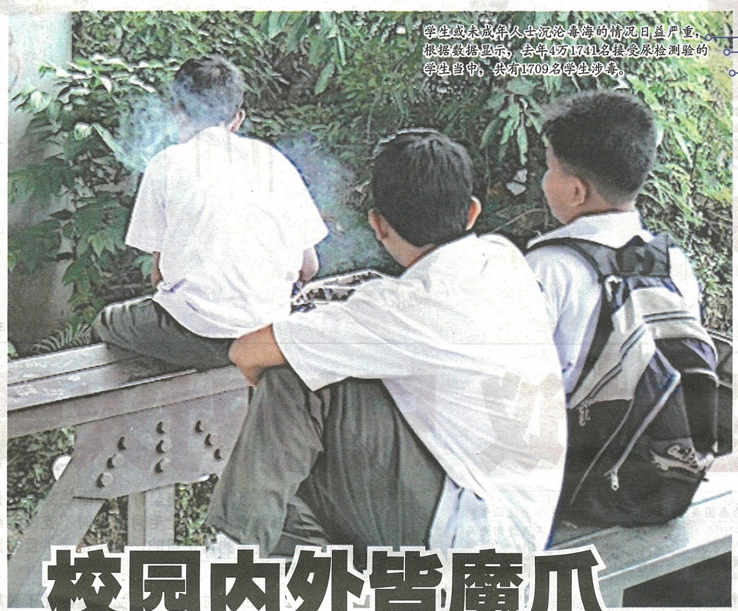
学生或未成年人士沉沦毒海的情况日益严重，根据数据显示，去年4万1741名接受尿检测验的学生当中，共有1709名学生涉毒。