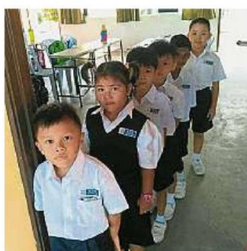
巴罗圣德华小6名一年级新生，最后第2位为全校唯一印裔学生。

讲演角落(speaker corner)。因人数不多，3校在宣导球鞋颜色的传达上也非常顺利，没有令家长混淆。