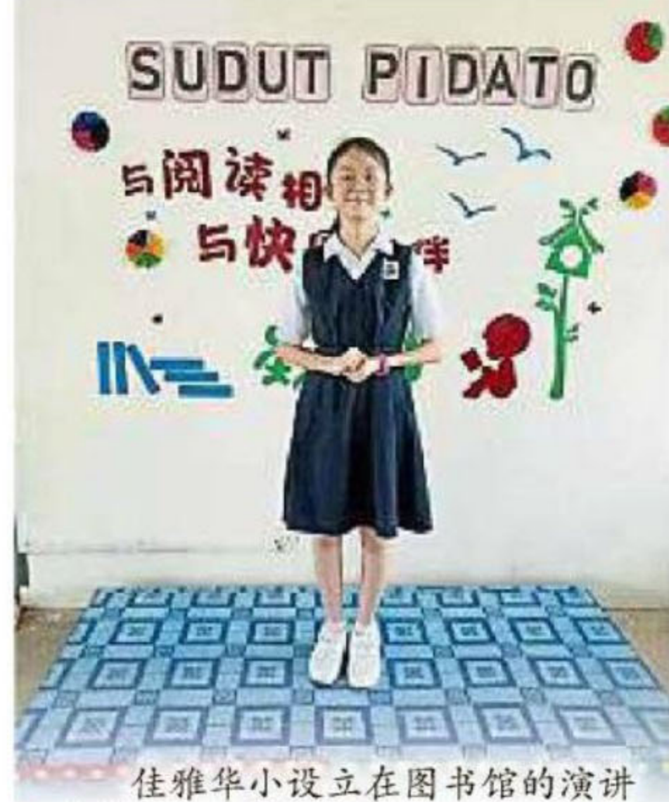
佳雅华小设立在图书馆的演讲角落。