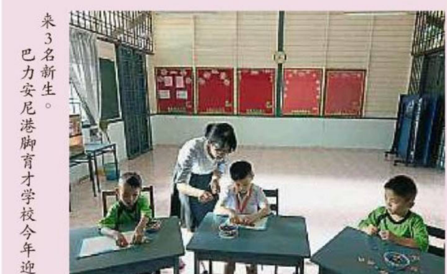
来3名新生。巴力安尼港脚育才学校今年迎

讲演角落(speaker corner)。因人数不多，3校在宣导球鞋颜色的传达上也非常顺利，没有令家长混淆。