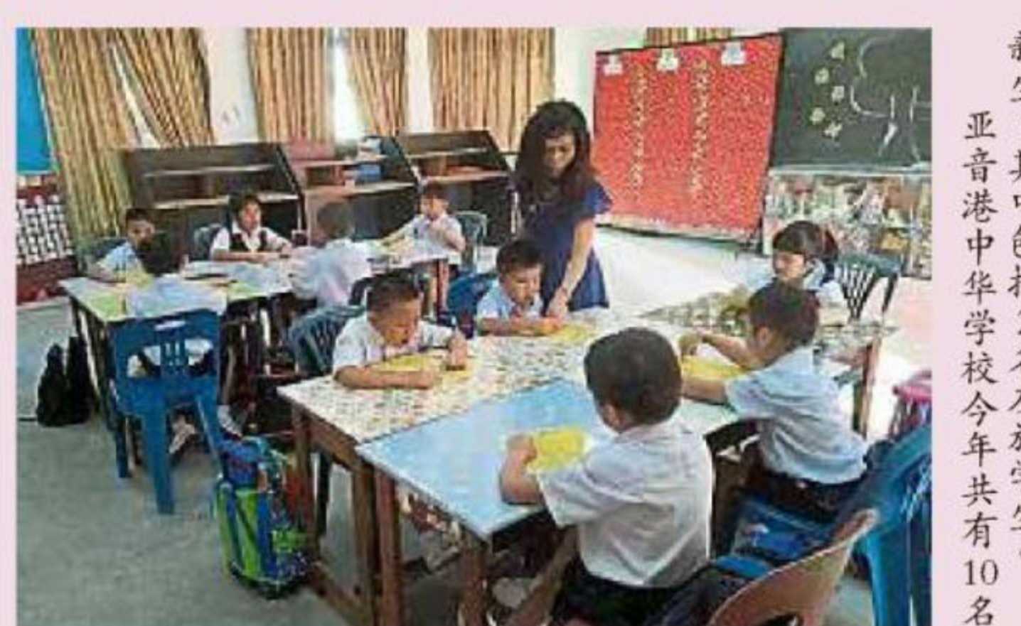
新生，其中包括2名友族学生。亚音港中华学校今年共有10名