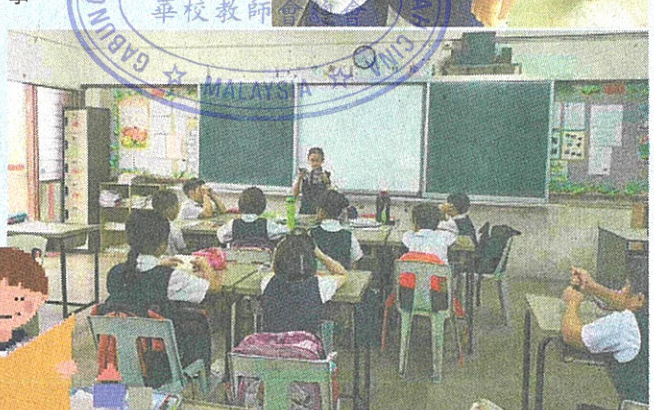
学生在班上朗读故事。

首先应该先对打算介绍的童书感兴趣，或者曾经阅读过，这样才有能力从当中选择有趣和吸引的作品，介绍给学生。其实，学生并非完全不爱阅读，而是缺乏能够将这些好书推荐给他们的大人。学生可能因为对这些书籍不熟悉，或者没有什么机会接触这些儿童文学书籍，才导致他们不主动阅读。就这样，在朗读、荐读、导读、默读中，我和学生变成了快乐的儿童文学阅读者。