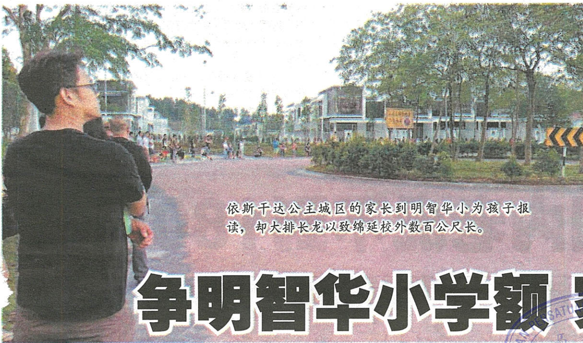
依斯干达公主城区的家长到明智华小为孩子报读，却大排长龙以致绵延校外数百公尺长。